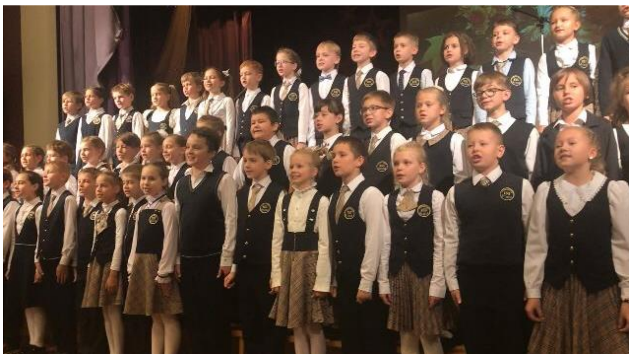
Хор 3-х классов